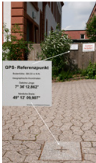
GPS-Vergleichspunkt in der Bahnhofstraße 24 in Pirmasens, vor der hinteren Einfahrt des Amtsgerichts

methode ortet man dabei unterschiedlich genau. Für alle diejenigen, die die Genauigkeit ihres GPS-Gerätes überprüfen möchten, bietet die Vermessungs- und Katasterverwaltung Rheinland-Pfalz jetzt einen neuen Service.